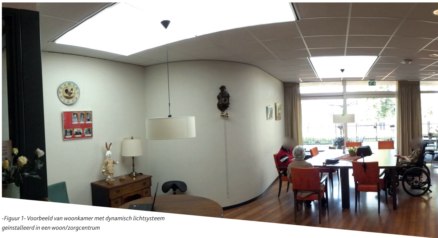
-Figuur 1- Voorbeeld van woonkamer met dynamisch lichtstelsel geïnstalleerd in een woon/zorgcentrum